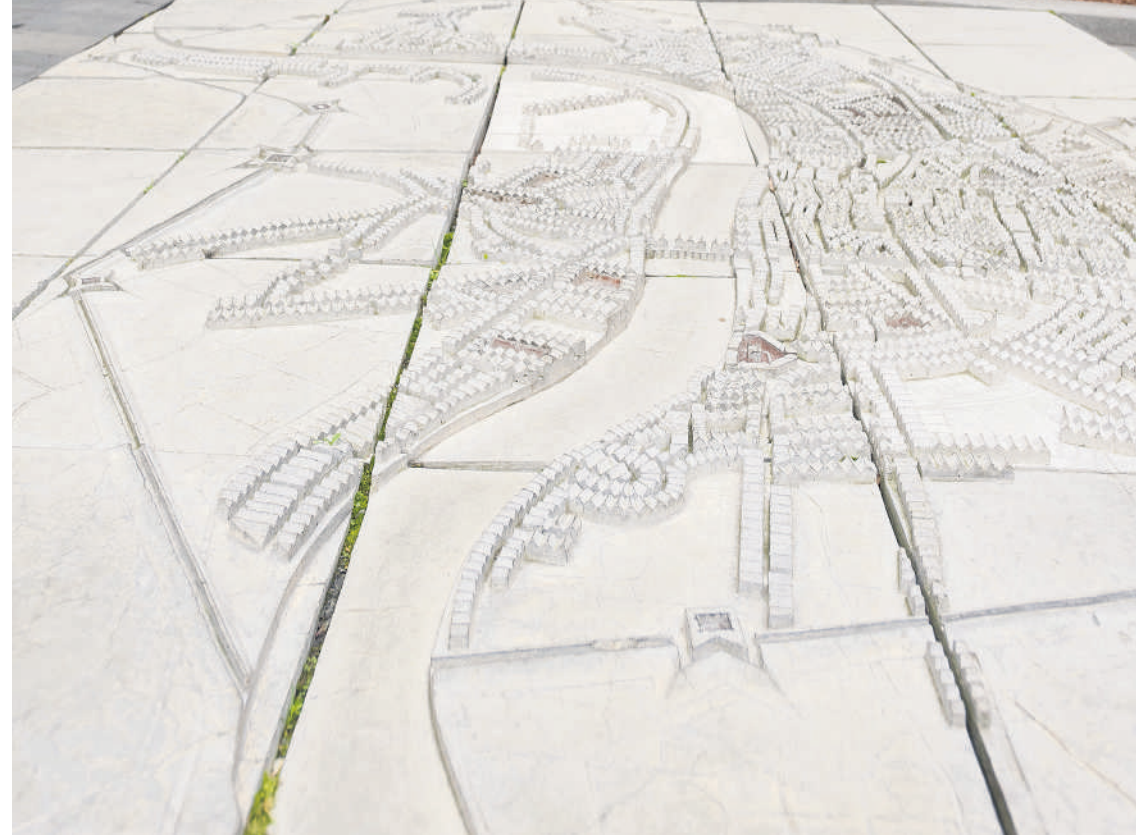
Het hoofdkantoor van Allen & Overy op Bishop Square in Londen. De internationale advocatenfirma verplaatst 180 hoogwaardige banen naar Belfast in Noord-Ierland.